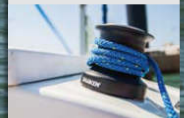
Dos winches Harken apoyan la maniobra y trimado de las velas en el piano, contando también con guaiacabos y stoppers.