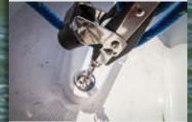
La escota de la mayor arraiga en el suelo de bañera con un montecarlo permitiendo un trimado fácil por parte del timonel o tripulación.