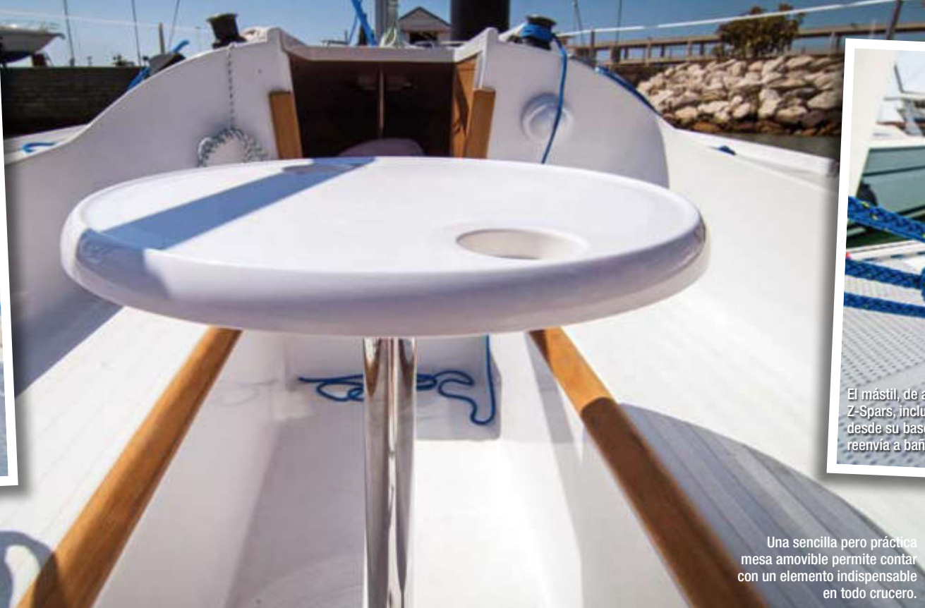
Una sencilla pero práctica mesa amovible permite contar con un elemento indispensable en todo crucero.