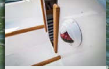
En la vertical del roof se inserta un compás, todo un detalle de la capacidad de equipamiento de esta pequeña unidad.

T ras el Tarsis 26 llega al mercado el Tarsis 20, un benjamín que fue presentado en el pasado Salón Náutico de Barcelona y que irrumpe con fuerza al presentarse como opción idónea para aquellos que buscan un barco con el que iniciarse en la vela o, simplemente, una unidad que cubra las necesidades para un día de navegación con un resguardo interior nada desdeñable que, incluso, ofrece la posibilidad de pasar la noche a bordo con comodidad para tres personas.