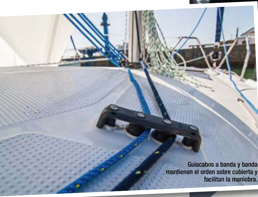
Guaiacabos a banda y banda mantienen el orden sobre cubierta y facilitan la maniobra.