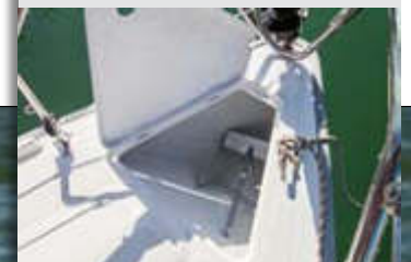
Un buen pozo de ancla nos permite estibar correctamente la maniobra de fondeo, completando el conjunto con sendas cornamusas a banda y banda.