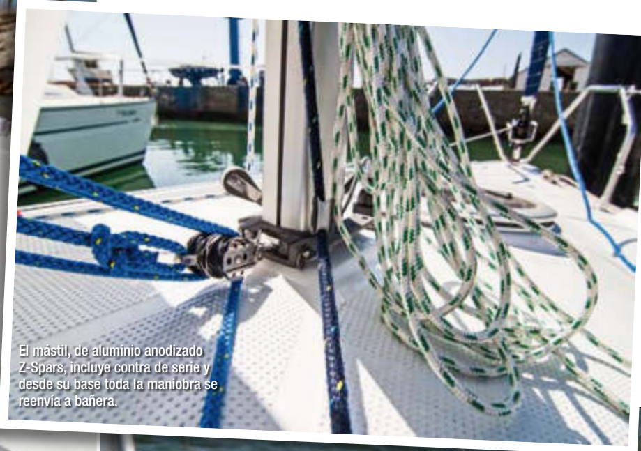
El mástil, de aluminio anodizado Z-Spars, incluye contra de serie y desde su base toda la maniobra se reenvía a bañera.